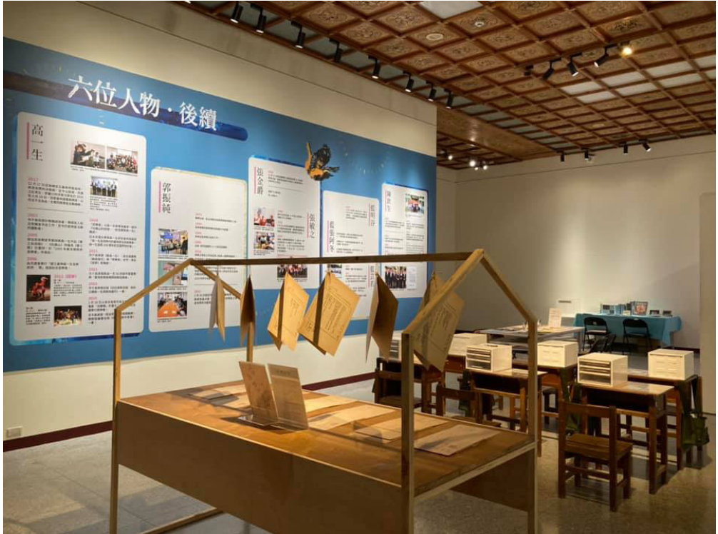
圖三、展覽裡搭配六位受難者生命故事的重寫判決書活動

領參與者，應用觀眾所重寫的判決書，分組創作判決書雕像，讓參與者透過創作過程，更深入地瞭解藝術家的表現技法與理念。